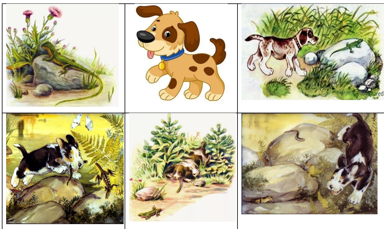
Рис. 1. Мнемотаблица к тексту

Приведем пример работы на уроке литературного чтения в 1 классе на тему «В.В. Бианки «Первая охота».