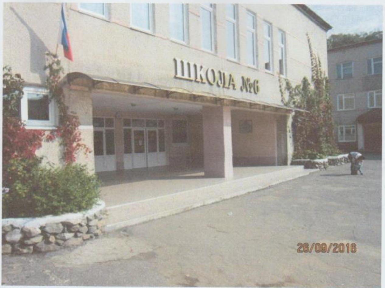
Фото № 2 Входа (входов) в здание