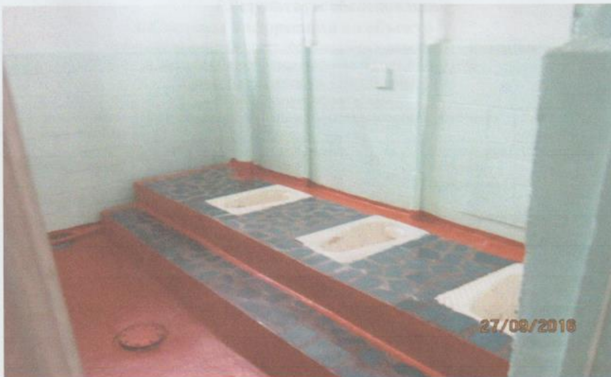
Фото № 5: Санитарно-гигиенических помещений

колясочников на второй и третий этаж, необходимо в ходе текущего ремонта выполнить мероприятия по обеспечению доступности для инвалидов (ДЧИ- (О,С,Г) одной из туалетных комнат на первом этаже.