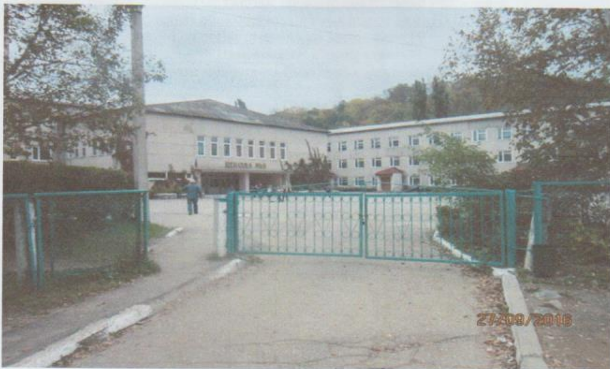
Фото № 1: Территории, прилегающей к зданию (участка)

обеспечения доступа ко всем входам в здание, нанесение контрастных полос вдоль направления движения к входу в здание