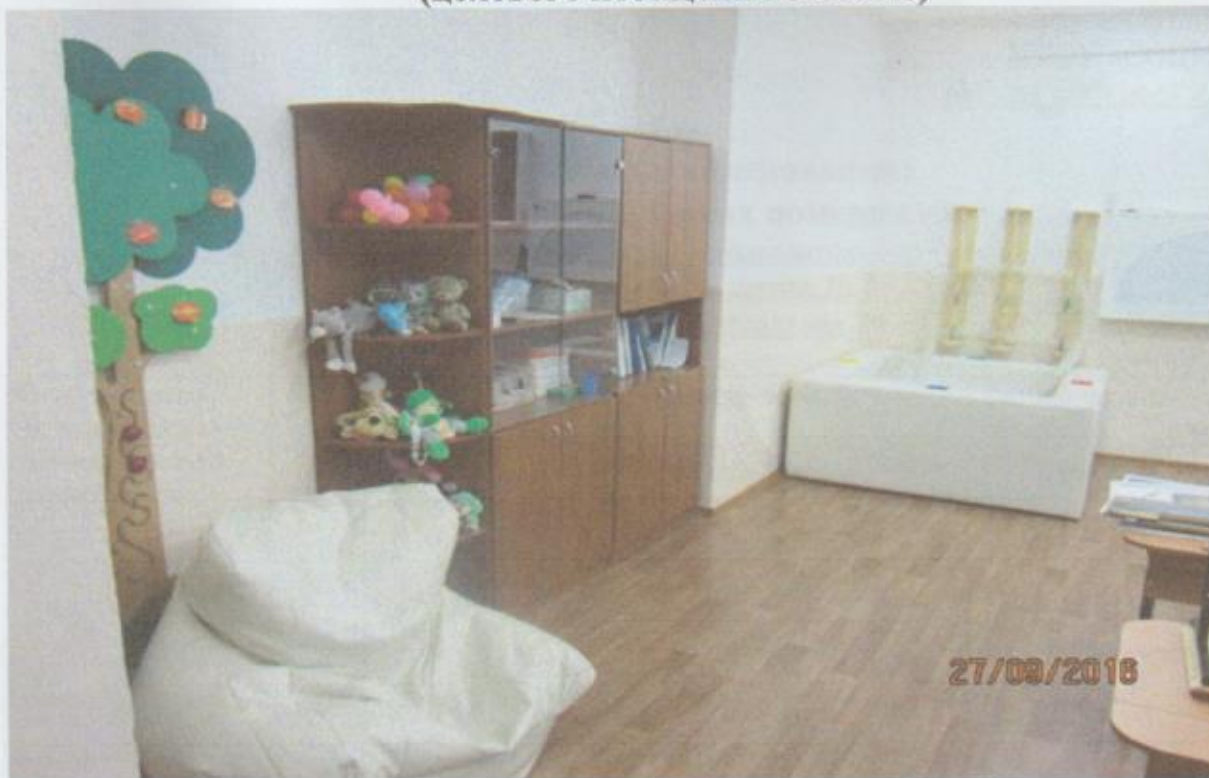
Фото № 4 Зоны целевого назначения здания (целевого посещения объекта)