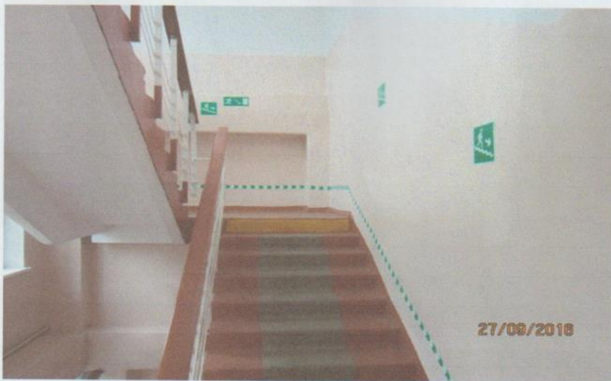
Фото № 3 Пути (путей) движения внутри здания (в т.ч. путей эвакуации)